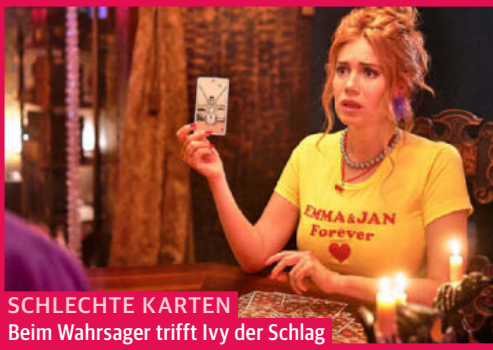
SCHLECHTE KARTEN Beim Wahrsager trifft Ivy der Schlag