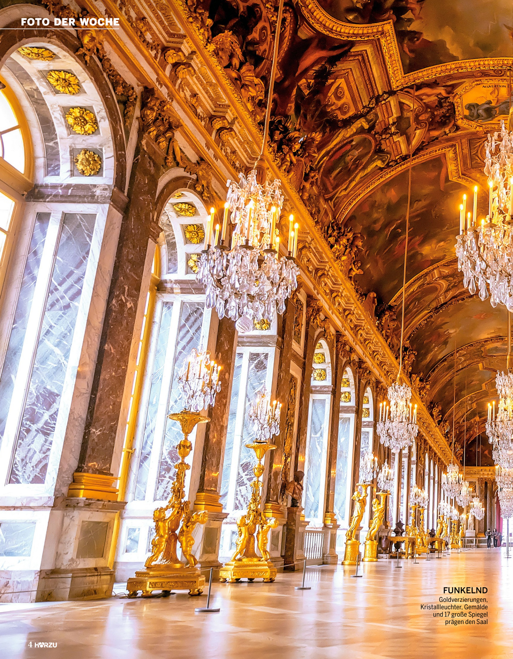
FUNKELND Goldverzierungen, Kristalleuchter, Gemälde und 17 große Spiegel prägen den Saal