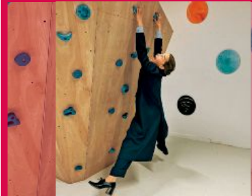
EMILIA CLARKE (35)

Stars auf Social Media: In dieser Woche gibt's sportliche Einblicke