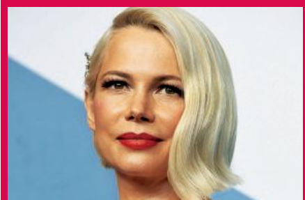
MICHELLE WILLIAMS (41)

Der australische Sänger muss einen erneuten Schicksalsschlag verkraften: Sein Sohn Jethro starb mit nur 31 Jahren. Bereits vor sieben Jahren verlor Nick seinen Sohn Arthur (†15).