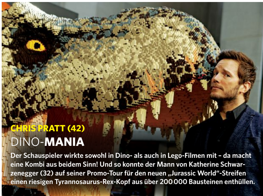
CHRIS PRATT (42)

Die Schauspielerin erwartet ihr drittes Kind. „Es ist spannend zu entdecken, dass etwas, das man sich immer wieder wünscht, nun nochmal klappt.“