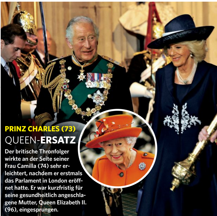
PRINZ CHARLES (73)

Limo fahren kann ja jeder. Der Hollywood-Held ließ sich zur Weltpremiere von „Top Gun: Maverick“ in San Diego spektakulär einfliegen und setzt damit neue Maßstäbe für Red-Carpet-Events. Übrigens: Tom besitzt seit fast 30 Jahren den Pilotenschein. Hier überließ er das Steuer aber jemand anderem: „Ich fliege diesen Helikopter, aber nicht heute.“ Trotzdem ein cooler Auftritt!