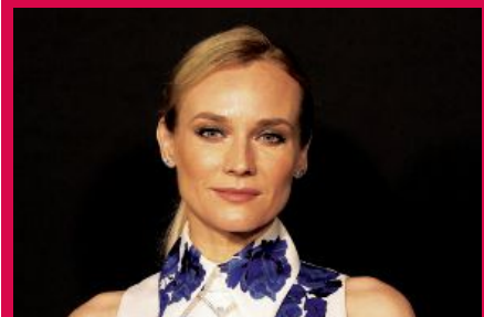
DIANE KRUGER (45)

Was passierte sonst noch bei den Stars? IN hat die wichtigsten News der Woche zusammengefasst