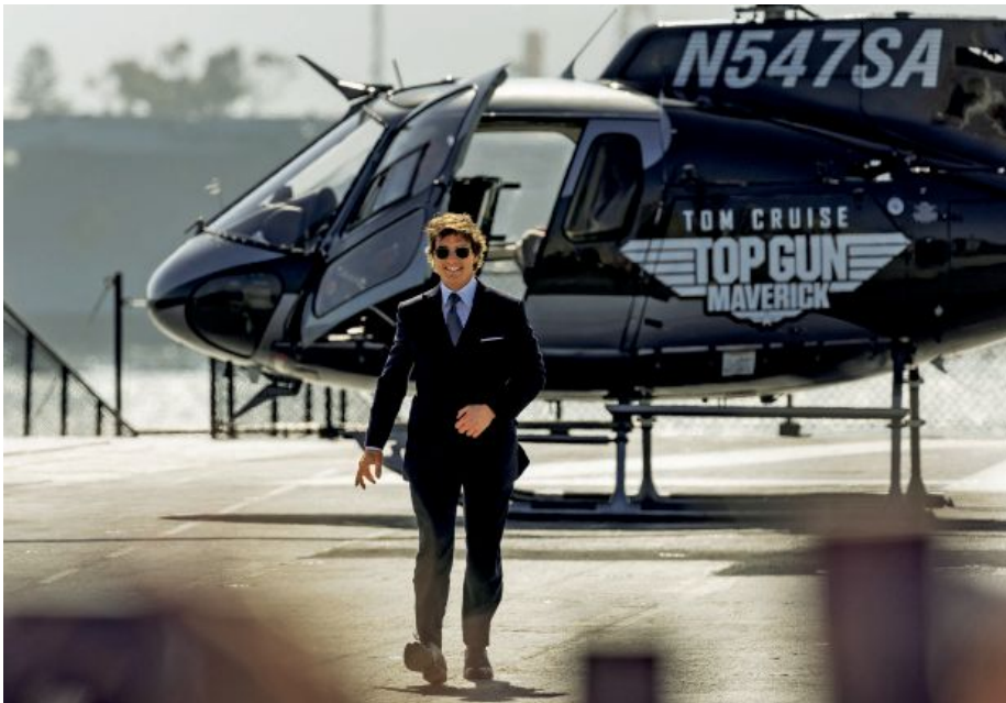
TOM CRUISE (59)