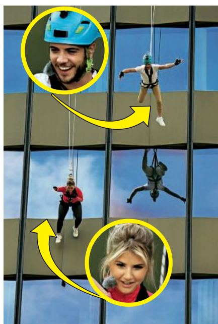
LUCA HÄNNI (27) & BEATRICE EGLI (33)