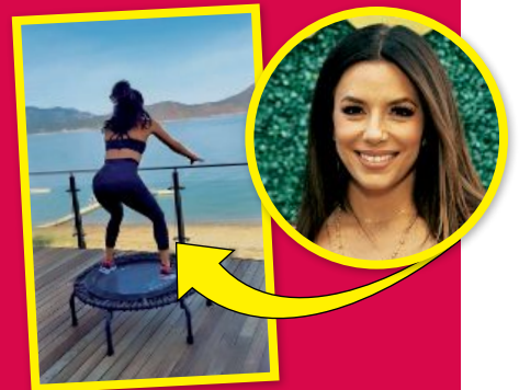
EVA LONGORIA (47)

Sieht nicht so aus, als hätte die Schauspielerin eine Chance, diese Wand zu bezwingen: „Wenn du versuchst zu klettern, es aber gar nicht kannst.“