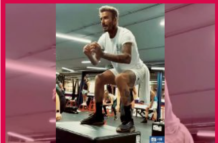
DAVID BECKHAM (47)

Die Schauspielerin stiehlt ihre Kurven gerne auf dem Trampolin. Hauptsache, sie hüpf nicht zu hoch und übers Geländer!