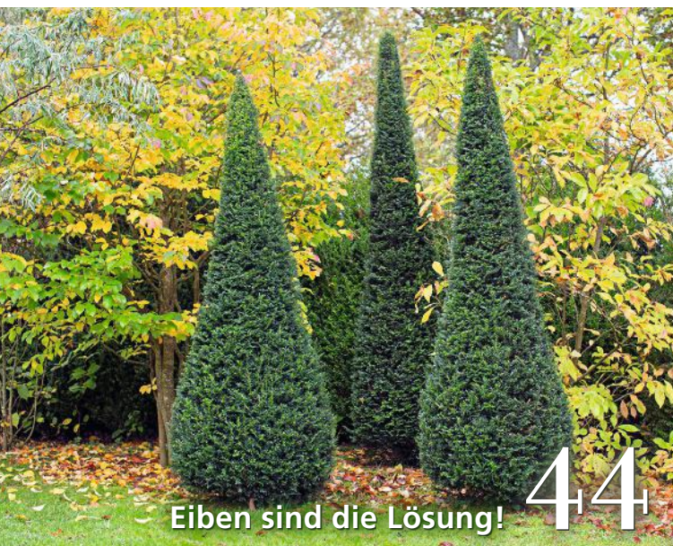
Eiben sind die Lösung!