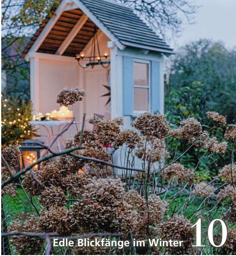
Edle Blickfänge im Winter