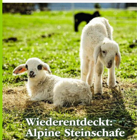
Wiederentdeckt: Alpine Steinschafe