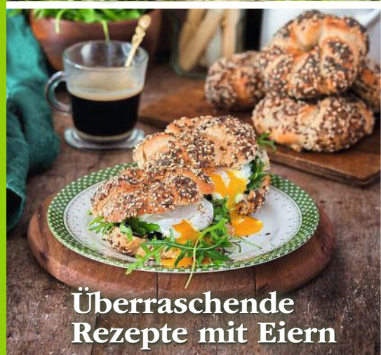
Überraschende Rezepte mit Eiern