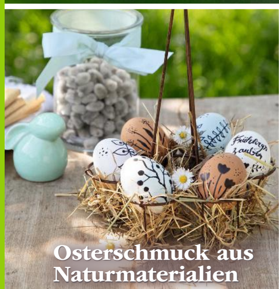
Osterschmuck aus Naturmaterialien

AT 6 € • CH 8,30 sfr • BeNeLux 6,20 € • FR, IT, ES, PTcont 7,30 €