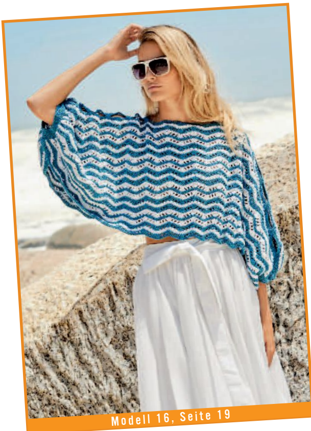
Modell 16, Seite 19