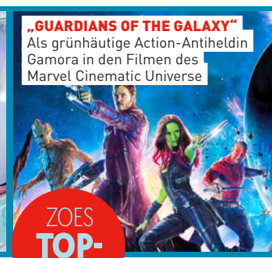
„GUARDIANS OF THE GALAXY“ Als grünhäutige Action-Antiheldin Gamora in den Filmen des Marvel Cinematic Universe