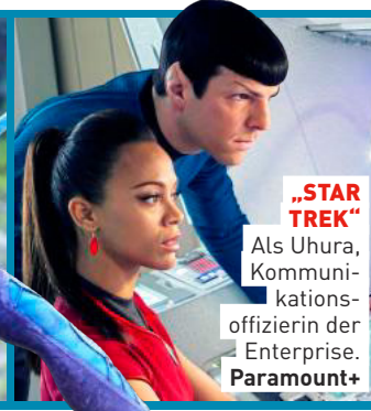
„STAR TREK“ Als Uhura, Kommunikations-offizierin der Enterprise.