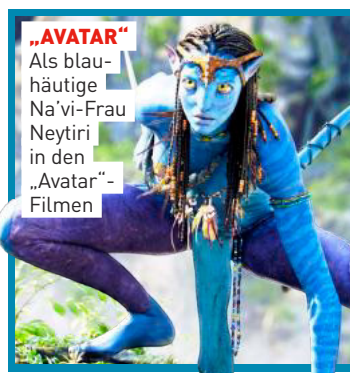
„AVATAR“ Als blauhäutige Na’vi-Frau Neytiri in den „Avatar“-Filmen